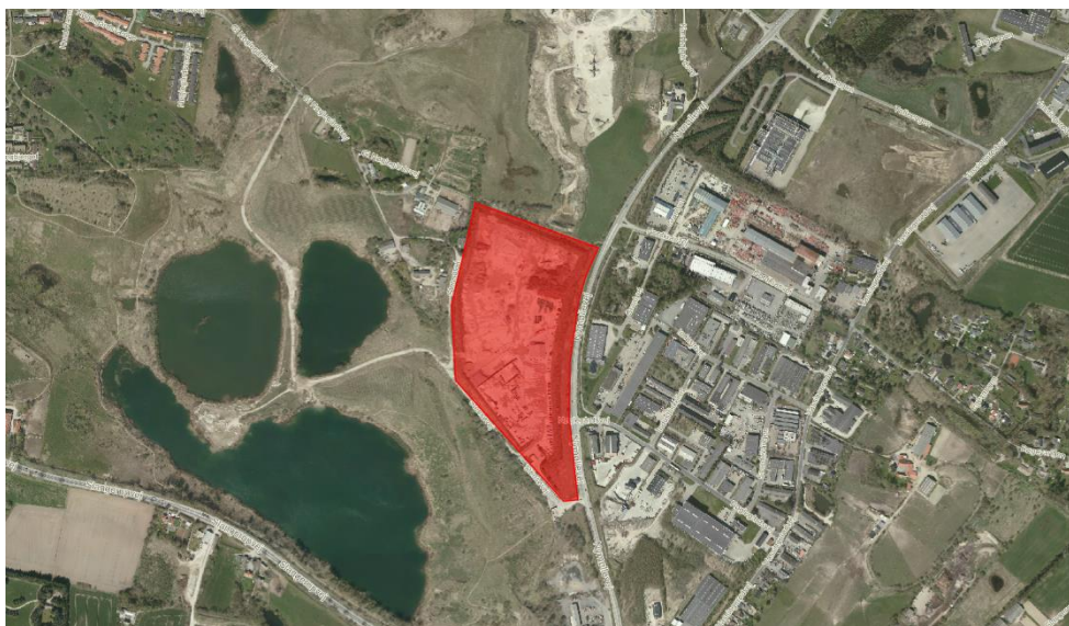
Kort 1 viser virksomhedens beliggenhed

Norrecco A/S, der er beliggende på Stensøvej 2 i Lynges, modtager og behandler blandet bygge- og anlægsaffald m.m.